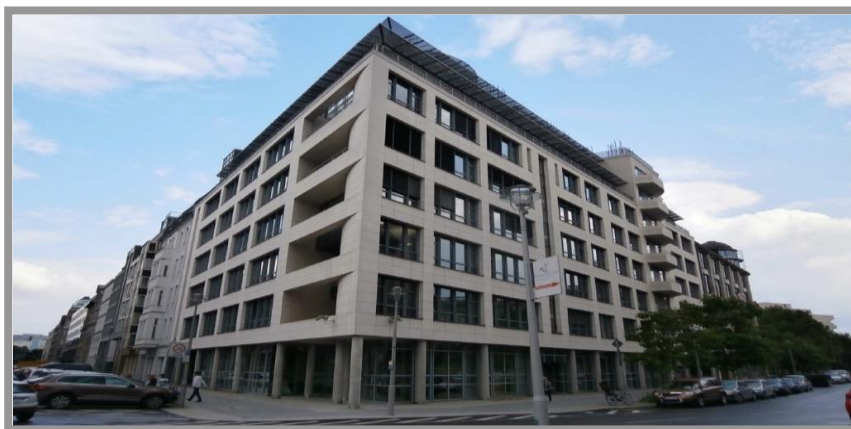
Kronenstraße 1, 10117 Berlin (roter Pfeil)

in der Nachbarschaft vieler Ministerien und des Bundesrates und nur 5 Minuten entfernt vom Brandenburger Tor.